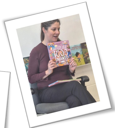
Un tirage d'un livre par classe a été offert par l'auteure